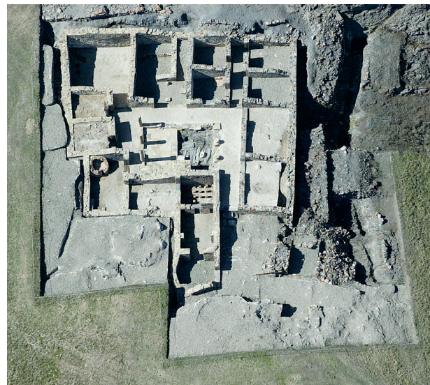
Vista cenital da área escavada Vista cenital del área escavada

A construción da domus e o modo de vida que trouxeron consigo os seus distinguidos ocupantes incentivou a adopción de novos costumes, usos e enxovais entre aquelas familias locais destinadas a dirixir as civitates establecidas por Roma.