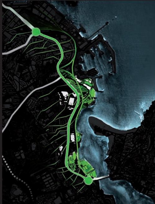
Equipamientos de la Salud