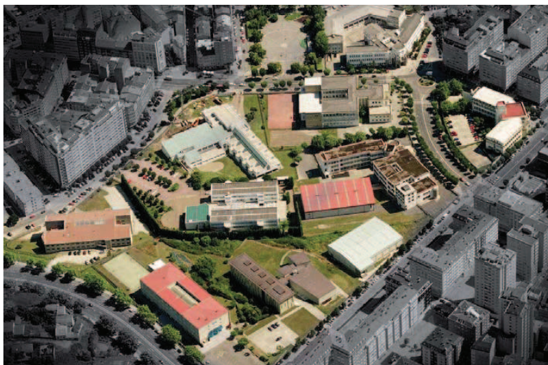
Campus de Riazor UDC