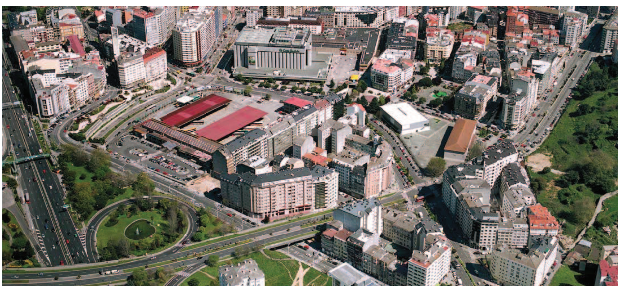
Estación de Autobuses