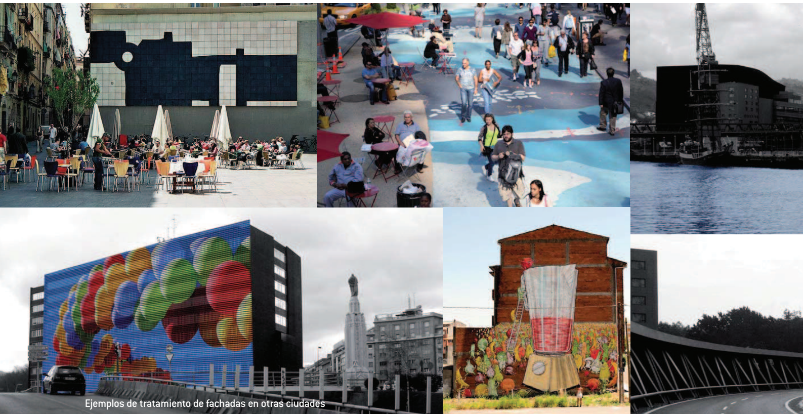
Ejemplos de tratamiento de fachadas en otras ciudades

elementos clave para organizar el tráfico en este viario central.