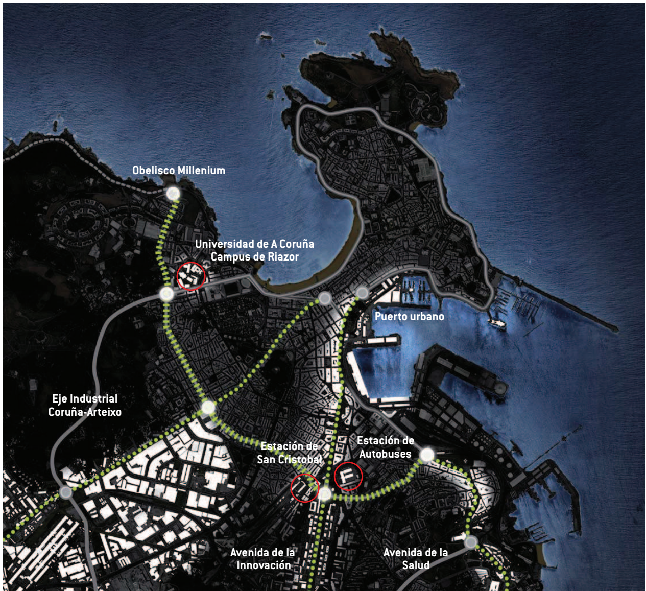
Nodos de la Ronda de los Barrios