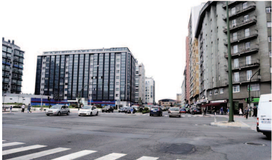
Antes y después en la Ronda de los Barrios