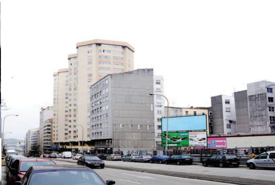
Antes y después en la Ronda de los Barrios