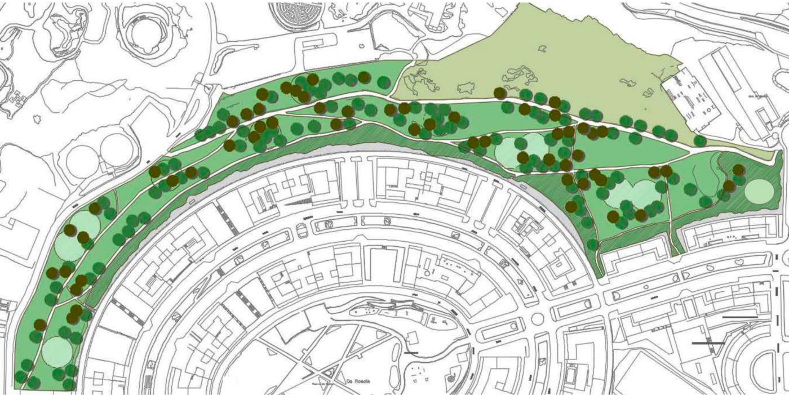
= LIÑAS DE DESEÑO