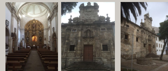
Iglesia de Las Capuchinas

Con arreglo a lo dispuesto en la Ley Orgánica 15/1999, del 13 de Diciembre de protección de datos de carácter personal, mediante la cumplimentación del presente documento el interesado consiente y autoriza que los datos solicitados sean incorporados en un fichero informatizado para uso de las actividades de la Fundación. El declarante podrá ejercer los derechos de acceso, rectificación y cancelación, así como oponerse a su tratamiento. Para ello, rogamos lo haga a través del correo electrónico: bibliocasaconsulado@gmail.com