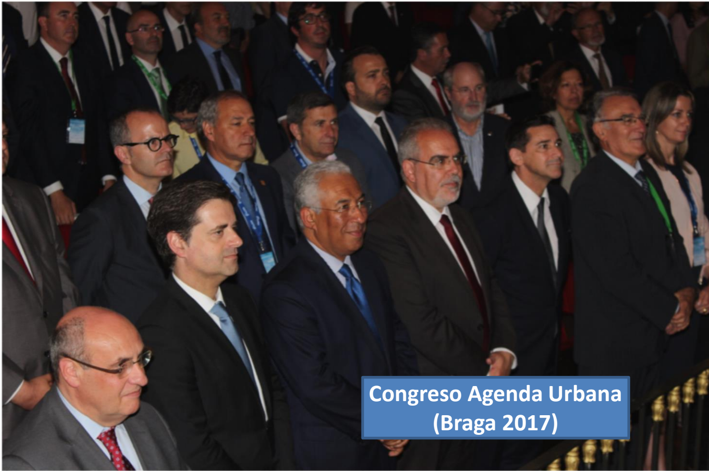
Congreso Agenda Urbana (Braga 2017)