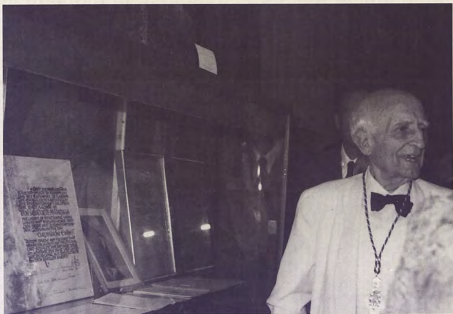
Don Salvador de Madariaga inaugurando en el Palacio Municipal, la Exposición organizada por el Instituto José Cornide de Estudios Coruñeses con motivo de su noventa cumpleaños. En ella figuraban ejemplares de sus obras en diversos idiomas, ediciones raras, valiosos manuscritos de sus libros, correspondencia con numerosas personalidades, fotografías, diplomas, etc.

Don Salvador de Madariaga nació en La Coruña el 23 de Julio de 1886, fue Ingeniero, catedrático en Oxford, embajador en Washington y París, dos veces Ministro, europeísta y liberal, Miembro de la Academia Española, Premio Carlomagno, escritor trilingüe, ensayista, historiador, novelista, poeta y columnista en los más importantes diarios del mundo.