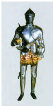
Arnés del Marqués de Cerralbo.

Durante la segunda mitad del siglo XVI, las relaciones entre España e Inglaterra se volvieron cada vez más hostiles hasta llegar al enfrentamiento bélico. La Gran Armada, destinada a la invasión de Inglaterra en 1588, resultó un completo fracaso. Consecuencia inmediata fue la preparación de una contraarmada inglesa integrada por 17.000 hombres para atacar los puertos españoles. A su frente estaba Francis Drake y el primer objetivo fue el ataque a la ciudad de A Coruña.