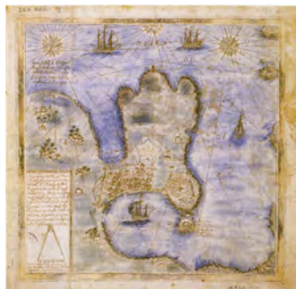
Plano de la ciudad y sus fortificaciones. Juan Santáns y Tapa, 1639.

A Coruña, una de las pocas ciudades de realengo de Galicia en el siglo XVI fue erigida por la monarquía de los Austrias en plaza fuerte, ciudad-fortaleza en el contexto político de enfrentamiento con las potencias europeas del Atlántico norte, especialmente con Inglaterra, destinándola consecuentemente a ser la capital administrativa del Reino. Los factores decisivos para esta elección fueron su privilegiada situación geoestratégica y su amplio y abrigado puerto.