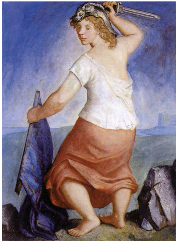
María Pita Isaac Díaz Pardo, 1946