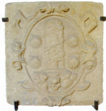
Escudo de A Coruña. Inicios del s. XVII. Museo Arqueológico de A Coruña.