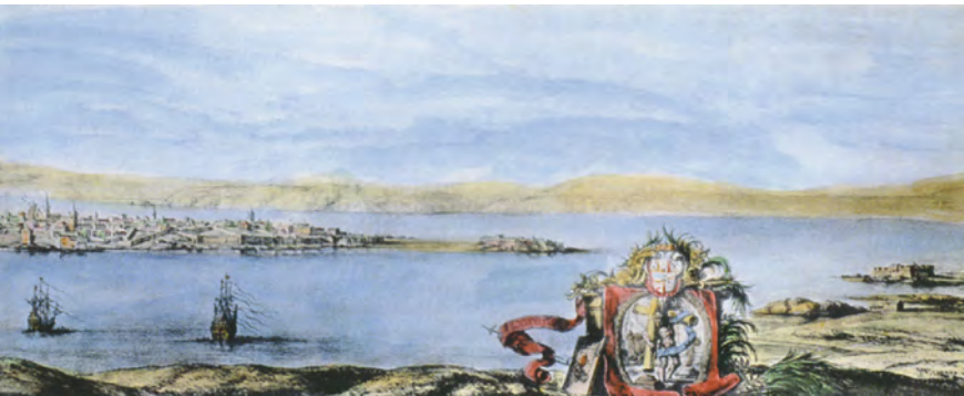
Panorámica de la ciudad de A Coruña. Pier María Baldi, 1669. Archivo Municipal de A Coruña.

La Pescadería , que brotó a partir de un pequeño barrio mariner, era un arrabal en continua expansión gracias a la pujanza de la actividad portuaria y a pesar de las ordenanzas que intentaban impedir el traspaso de población de la ciudad vieja hacia ella. En ella residían los pescadores, marineros, mercaderes y soldados.