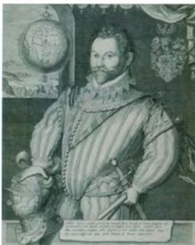
Retrato de Francis Drake.