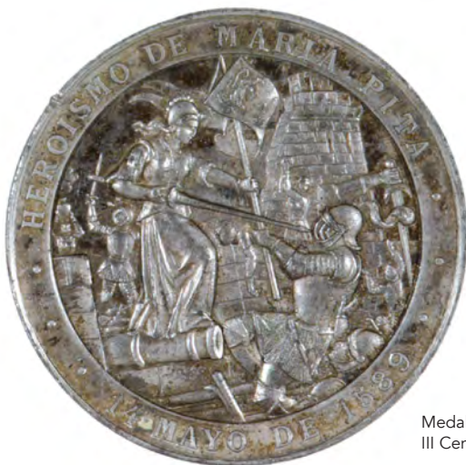
Medalla del III Centenario.

La superioridad de fuerzas militares del invasor era abrumadora. Por tanto, el fracaso inglés en el asalto a la Ciudad Alta sólo se explica por la férrea resistencia de toda la población refugiada en ella, y singularmente, por la activa participación de las mujeres. La figura de María Pita se convirtió con el tiempo en símbolo de este heroísmo.