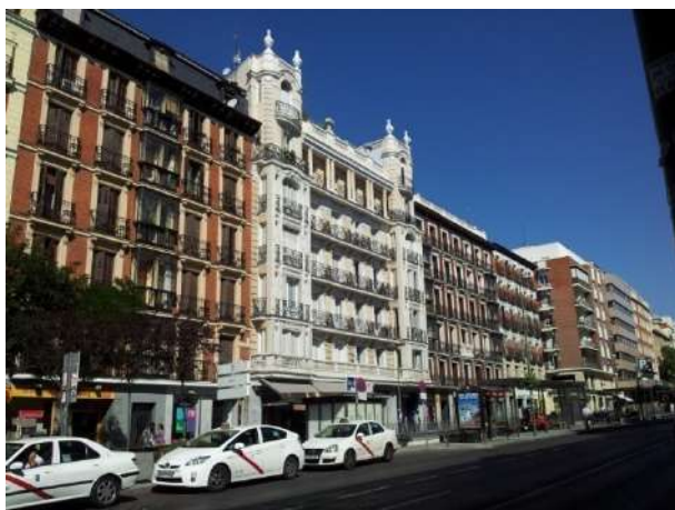
Imagen de Madrid

Si la famosa Cumbre de Río de 1992 puede considerarse un hito en la institucionalización de la conciencia ambiental a la escala global es en gran medida porque supuso la constatación definitiva de una realidad de crucial importancia: vivimos en un planeta urbano y, por tanto, el escenario fundamental desde el que hacer frente a la crisis ambiental es el que ofrecen las ciudades y sus entornos territoriales de influencia.