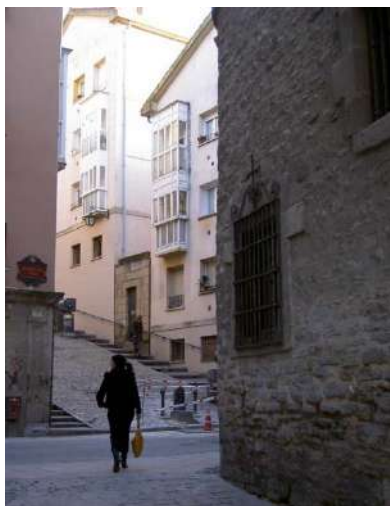
Imagen de Vitoria

Aunque las decisiones en relación con lo que ocurre en el territorio se producen en gran medida en instancias administrativas por encima del poder de decisión del municipio e incluso en muchas ocasiones trascienden las fronteras nacionales y la capacidad de control por parte de los ciudadanos que habitan realmente los territorios, la realidad es que la capacidad de decisión a la escala local sigue siendo relativamente grande en lo que respecta a muchos de los sectores clave relacionados con el cambio climático, desde la planificación de los usos del suelo y las infraestructuras locales, hasta la selección de los materiales que han de configurar los espacios públicos o la especies vegetales destinadas a naturalizarlos, aspectos todos en los cuales incide especialmente la presente Guía.