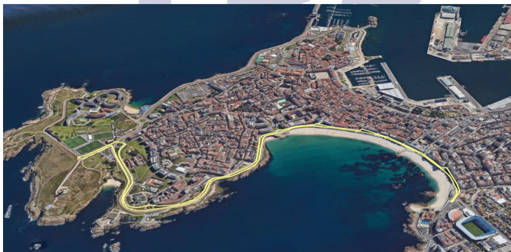
Plan B. Recorrido absoluto detallado según plano.