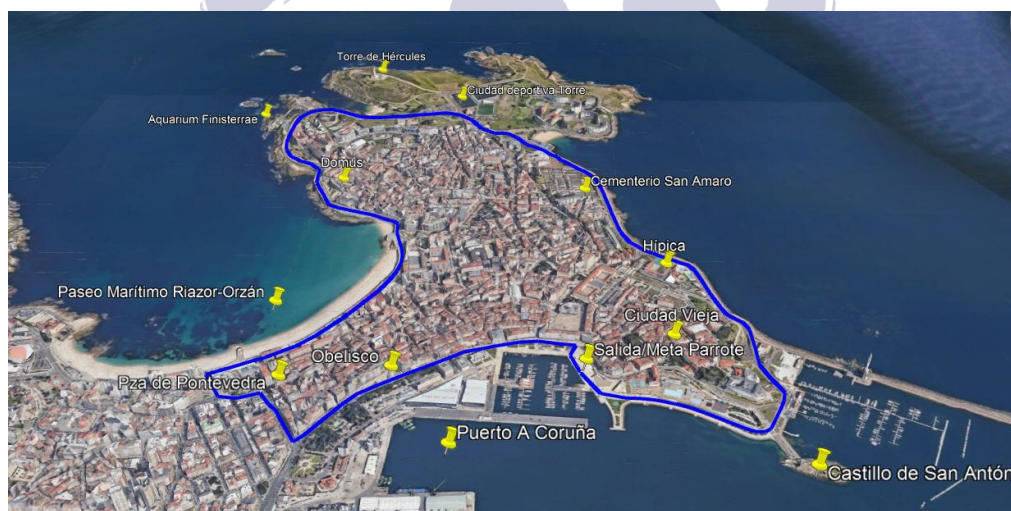
Plan A. Recorrido absoluto detallado según plano.

Meta: O Parrote/Marina 43°22'8.35" N – 8°23'43,15" W