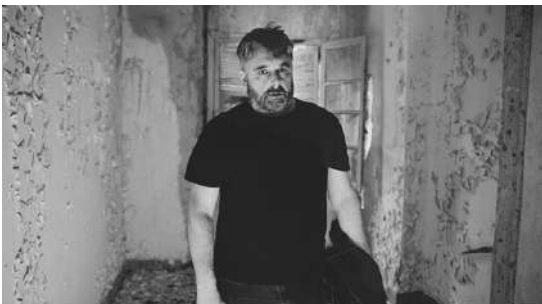
ANGEL NOVCAD | Live

Entradas a la venta en www.fanzinefest.com