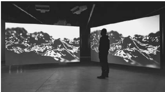
AUTOESCOPIA, DE COLECTIVO MIL 111 Proyección

FPS-BPM es la sección de Fanzine Fest dedicada al cine y al sector audiovisual, que refleja el estrecho vínculo entre la electrónica y las artes visuales. Comisariada por María Núñez y Juan Lesta, ofrece proyecciones, sesiones inmersivas 'full dome' y coloquios con artistas. La jornada, de acceso libre hasta completar aforo en la Domus, acogerá proyecciones de piezas visuales y un coloquio con el público.