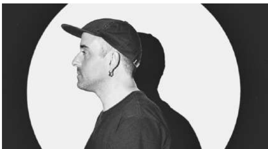
AMULADOR | Live

Segunda jornada de celebración de Fanzine Fest 2023 en la Fundación Luis Seoane, centro de arte que acoge, cada año, el escenario SON Estrella Galicia. Acceso libre hasta completar aforo.