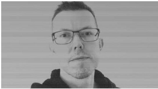
NULLPTR | Live

El británico Eddie Symons es un productor radicado en Cambridge que debuta en 2016 en el sello Detroit Underground. Las influencias de este artista se encuentran en el IDM de la década de los 2000, donde originalmente publicó canciones, bajo el alias Bovaflux, con Highpoint Lowlife Records. Esas influencias continúan presentes en su material actual bajo el alias Nullptr , que podemos escuchar en sellos respetados como Central Processing Unit, Klakson, SolarOneMusic y Fanzine Records.