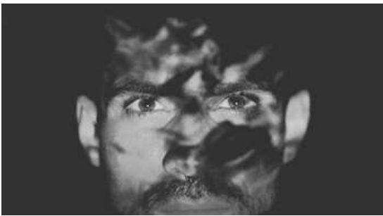
COLECTIVO MOM | VJ set