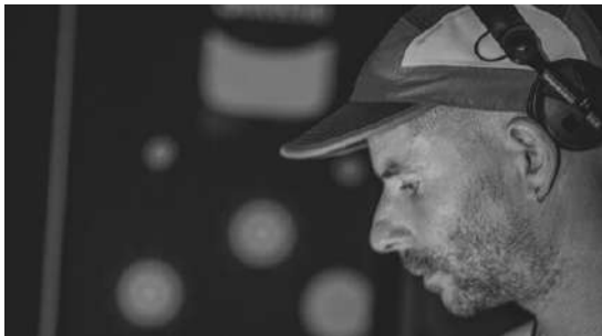
PUMU | DJ set

El británico Eddie Symons es un productor radicado en Cambridge que debuta en 2016 en el sello Detroit Underground. Las influencias de este artista se encuentran en el IDM de la década de los 2000, donde originalmente publicó canciones, bajo el alias Bovaflux, con Highpoint Lowlife Records. Esas influencias continúan presentes en su material actual bajo el alias Nullptr , que podemos escuchar en sellos respetados como Central Processing Unit, Klakson, SolarOneMusic y Fanzine Records.