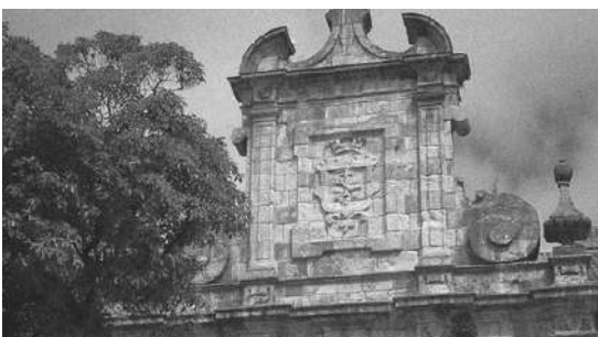
IGLESIA DE LAS CAPUCHINAS | 17.00 horas