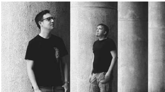
LEFRENK & THE PANIC ROOM | Live AV

Jornada inaugural en Planetario x WE. Entradas agotadas.