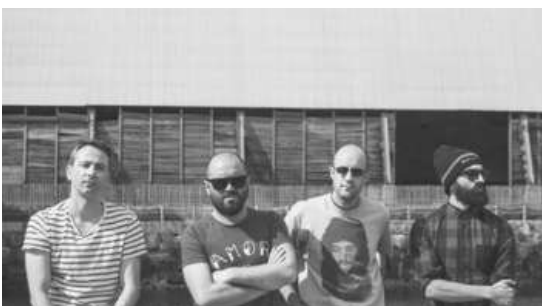
MÚSCULO | Live

Uno de los artistas más relevantes de la escena nacional e internacional. Productor musical, diseñador de sonido y compositor visual de Madrid, lleva más de una década desarrollando música electrónica. Su trabajo se centra en el material visual y sonoro electrónico progresivo, secuencial y minimalista. Fundador los sellos Drivecom, Tesla Electronics y Subnet, en 2014 crea Artificial Domain . Con él apuesta por la música experimental y estilos sonoros de vanguardia y genera una plataforma para la creación de contenido audiovisual.