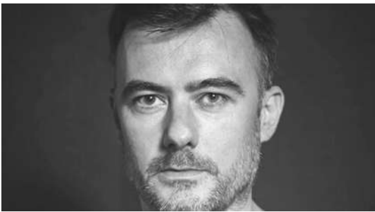
HOAX BELIEVERS | Live

Uno de los nombres clave para entender la escena electro actual y, quizás, de los artistas más versátiles del circuito underground. Incansable coleccionista de discos y responsable del sello Distrito 91, tanto en sus sesiones como en sus producciones podemos encontrar un amplio abanico de influencias, desde sonoridades clásicas de electro y techno Detroit hasta acid y breaks de la escena rave de los noventa.