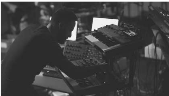
SOUND SYNTHESIS & DIGITAL NATURE Live AV

El ritmo y el ruido son sus señas de identidad. Las producciones del británico encuentran poesía en las comunicaciones ilegibles, despojando el significado de la respuesta emocional cruda. Cada pista es una losa visceral de poder, con el objetivo de deconstruir cualquier idea preconcebida. En sus sesiones, el oyente está sujeto a abrumadoras olas de estimulación hipersensorial. Sea cual sea la forma que adopte su música, continúa evolucionando, explorando los límites del sonido y el espacio.