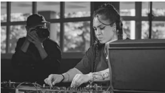
TEKKA | DJ set

El proyecto más ambicioso de Blach, un clásico de la escena gallega. Tras más de 20 años tras los platos, se reinventa en formato directo con Soul Lazh . En este nuevo proyecto se acompaña de cajas de ritmos, sintetizadores, pedales de efectos y distorsiones. Techno dinámico y contundente, cargado de potentes secuencias sintetizadas, con melodías hipnóticas y atmósferas envolventes.