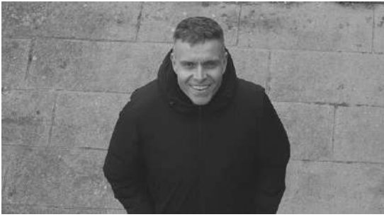
ROI & The Panic Room | Live AV

ROI es una de las mentes más despiertas y creativas de la escena, pero también un productor insaciable a la hora de experimentar con la electrónica desde todos los ángulos. Como dj consigue combinar multitud de géneros con coherencia y disfrute a partes iguales. The Panic Room es un polifacético artista que, tomando como base la fotografía, genera videos en los que la estética viene condicionada por la cadencia del trabajo fotograma a fotograma.