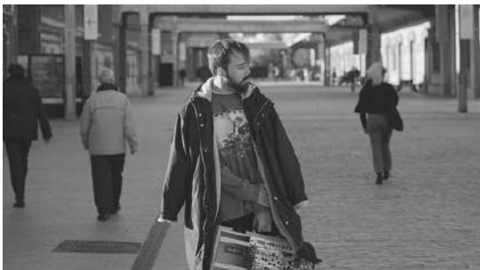
CYRA, DE VERBOSE Proyección