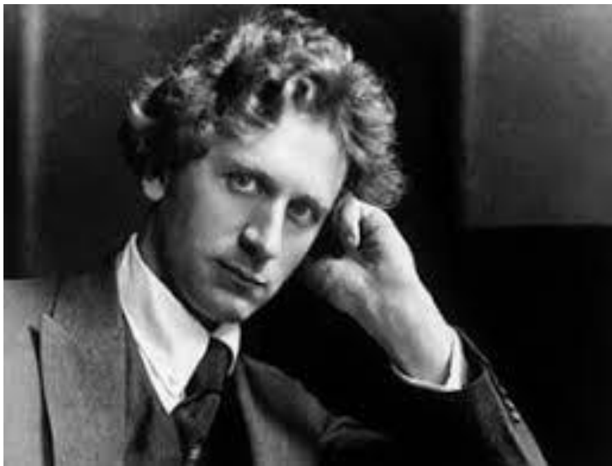
P. Grainger (Melbourne 1882-Nueva York 1961)

Se trata de una composición que utiliza una melodía popular y que por procesos contrapuntísticos y diferentes orquestaciones es ideal para presentar de forma auditiva las diferentes familias de las que consta una banda sinfónica.