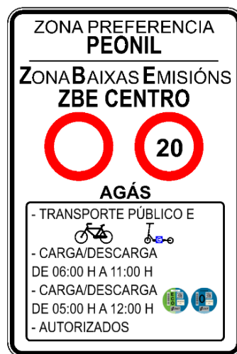
SEÑAL DE RESTRICCIÓN DE ACCESO