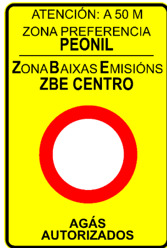
SEÑAL DE PREAVISO