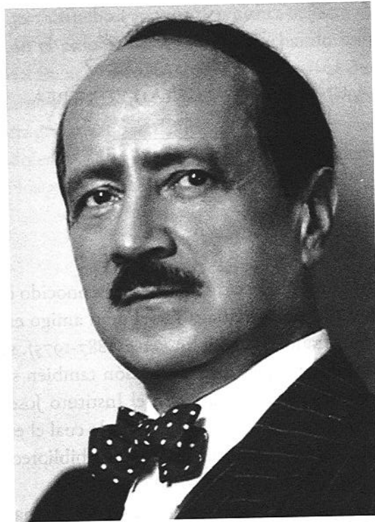
15.1. Fotografía de Saint-John Perse tomada en torno a 1960.

Baroja, Pérez de Ayala, Miró, Valle-Inclán, Ortega, Pidal (otro coruñés), Azaña... Y de entre los segundos, fue amigo de Bernard Shaw, Einstein, Russell, Kipling, Welles, Tagore, Valéry, Maurois, Ravel, Perse y Camus, entre otros muchos. De Kipling, un personaje poco sociable, tradujo numerosos poemas, lo que le llevó varias veces a su casa. Madariaga, dentro de su inmenso polifacetismo cultural, fue uno de los primeros impulsores de los estudios de literatura comparada. Crítico demoledor