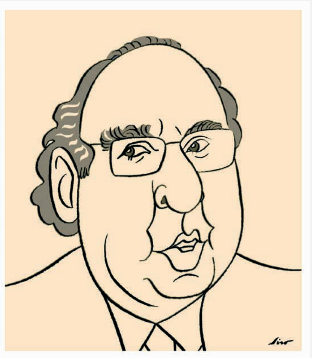
→ Debuxo de Siro López

Coherencia. Rigor. Proximidade. Vontade. Impulso. O paso polo mundo de Barreiro foi esa mestura de racionalidade e paixón polo pasado, de principios firmes. Habitando nunha terra que, como el mesmo dicía, era «tan ácida que ata come os ósos dos seus mortos». A súa presenza defínese cunha verba: auctoritas . Agradecemento nesta obra a unha personalidade senlleira que non deixaba a ninguén indiferente. Profesor Barreiro.