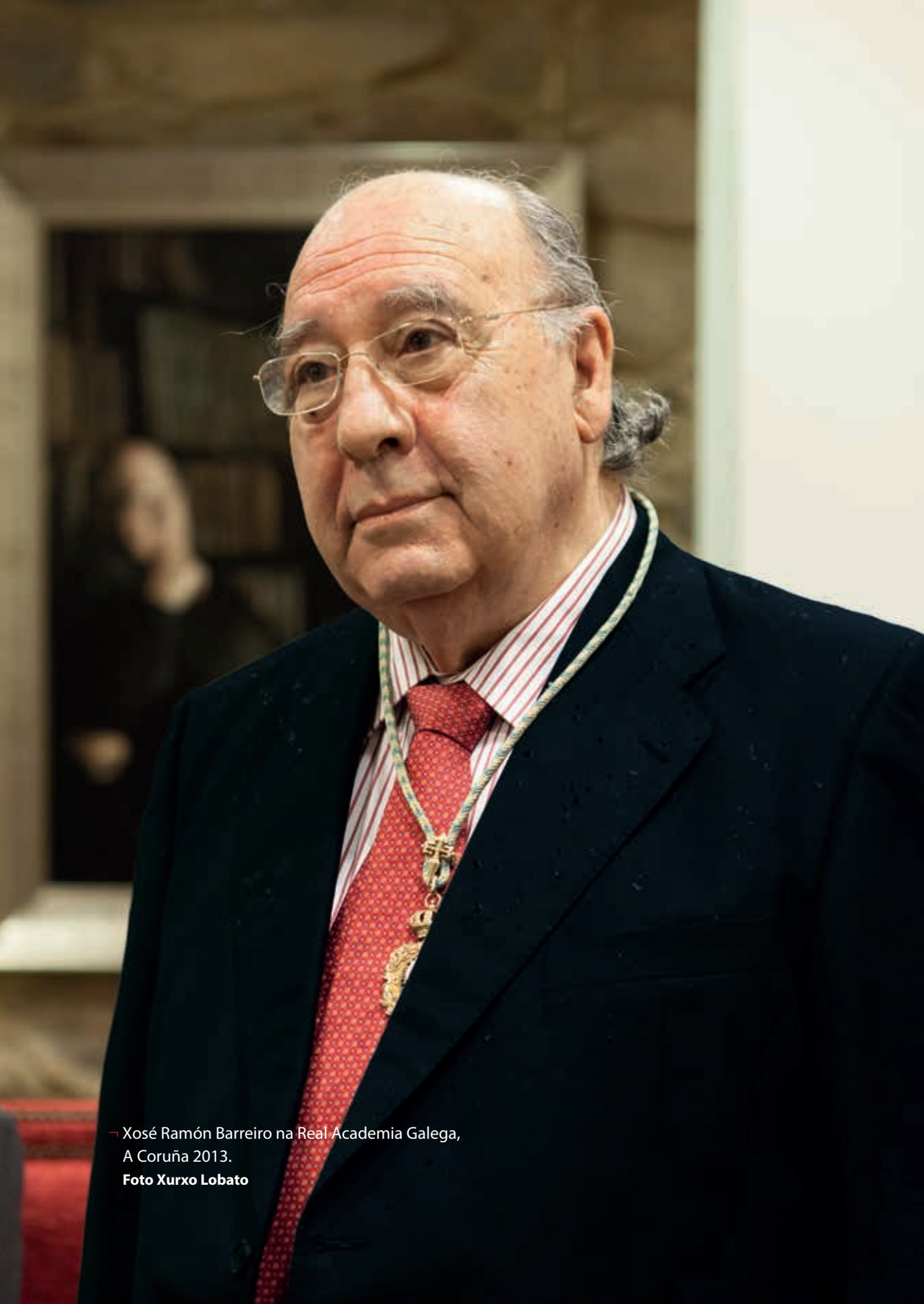
— Xosé Ramón Barreiro na Real Academia Galega, A Coruña 2013.