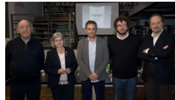
→ Presentación do nº1 da revista do Instituto Cornide, nova etapa (12 de xuño de 2018)

Ademais, o 23 de febreiro de 2017 Barreiro presentou, en nome do Instituto, a conferencia de Olga Glondys, «Salvador de Madariaga como constructor do diálogo con Europa desde o liberalismo». Desta mesma autora xa presentara o 18 de xullo de 2013 o libro La guerra fría cultural y el exilio republicano español. Cuadernos del Congreso por la libertad de la cultura (1953-1965) , publicado o ano anterior en Madrid polo Consejo Superior de Investigaciones Científicas.