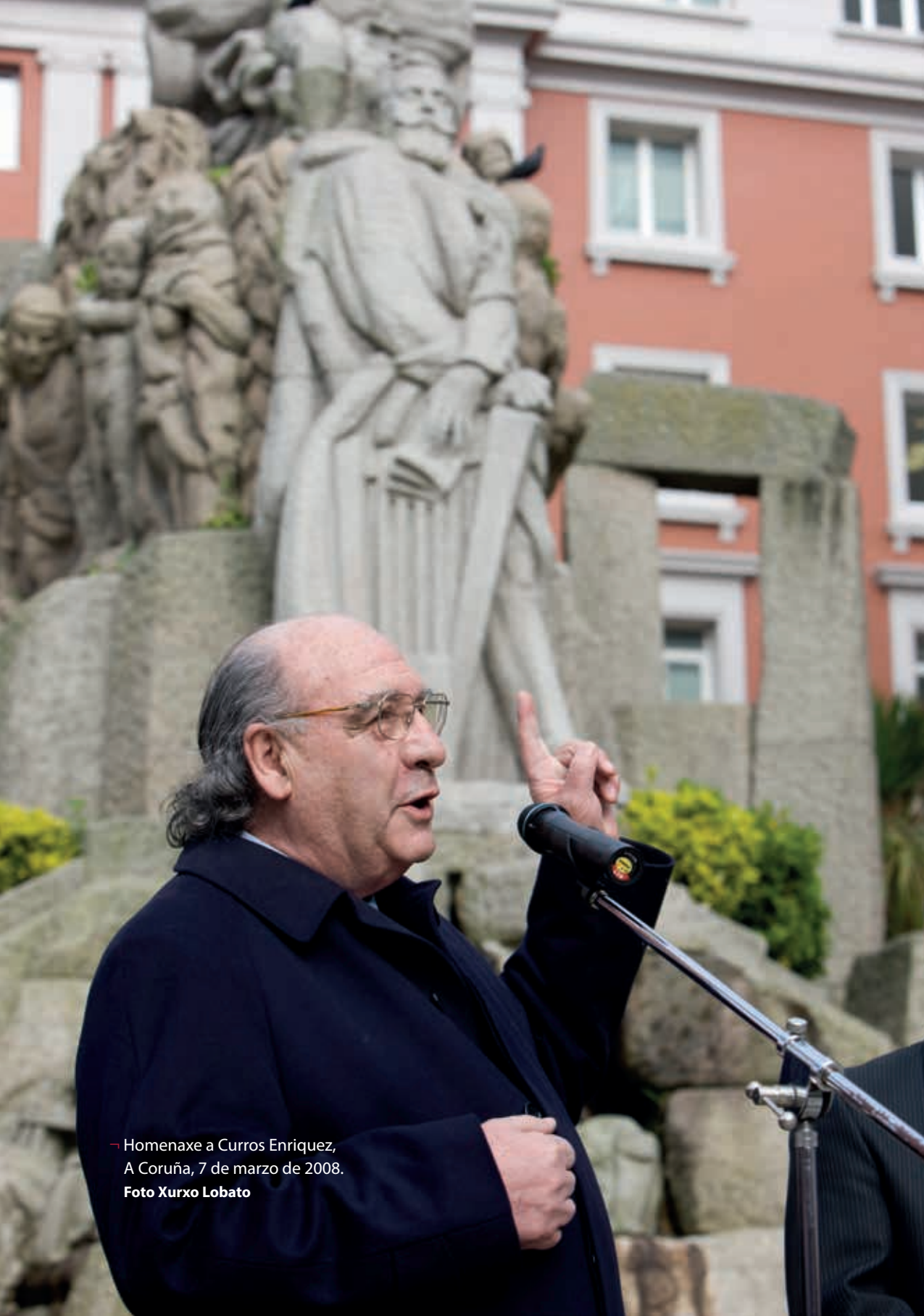
— Homenaxe a Curros Enríquez, A Coruña, 7 de marzo de 2008.

A capacidade de produción intelectual de Xosé Ramón Barreiro sempre asombrou o noso entorno. Esa cualidade innata de saber ler en pouco tempo con quen te comunicas é produto de moito esforzo en tentar entender aos demais. Esa imponente presenza física que alimentaba aínda máis cunha voz rotunda era resultado dunha coidada formación e de moito traballo posto nas capacidades comunicativas do discurso. A súa vida era traballar polo pasado, investigando, descubriendo. Como se entende nesta actualidade tan dependente das cifras, en volume de horas de traballo e esforzo ese traballo resultaría difícil de cuantificar. Certo que os CV's dos que nos atopamos neste ámbito das Humanidades sempre se cuantifican finalmente en decenas, centenas de citas... Pero con Barreiro iso multiplicábase.